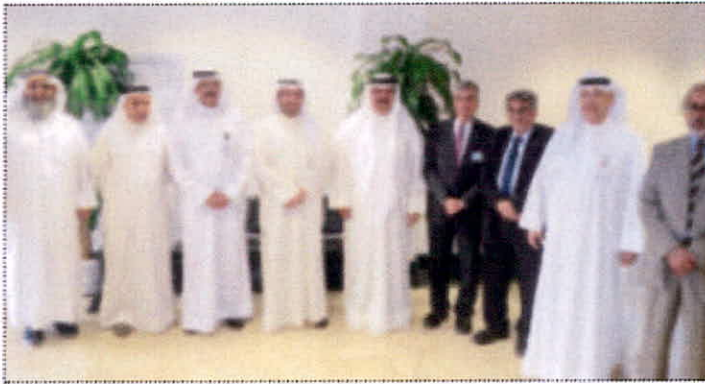
الشيخ عبدالله الحمود والمضف والأنصاري مع المشاركين في الفعالية

المضف: نشر الوعي للحفاظ على كوكب الأرض واستدامة موارده البشرية